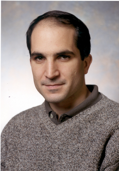
Afbeelding 2. Juan Maldacena

hetzelfde systeem gaf. Dit systeem was in zekere zin nog niet erg fysisch: Maldacena beschreef een heel symmetrisch zwart gat in vier ruimtedimensies (dus één meer dan in onze werkelijke natuur), met behulp van duale natuurwetten in drie ruimtedimensies. Al snel bleek de beschrijving van Maldacena echter het topje van een ijsberg, en op den duur werden er ook allerlei duale beschrijvingen gevonden van systemen die de fysische werkelijkheid beter benaderen.