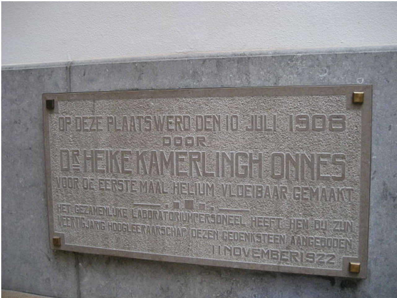
Afbeelding 2. Plaquette uit het KOG. De plaquette die herinnert aan het vloeibaar maken van helium door Kamerlingh Onnes.

Nu klinkt dit misschien ‘makkelijk’, maar aan het begin van de 20e eeuw was dit op het technische vlak een gigantische uitdaging. Na de ontdekking van de vloeibare fase van helium stuitte Kamerlingh Onnes in 1911 op supergeleiding van bijvoorbeeld kwik, met behulp van dezelfde opstelling die ook voor het koelen van helium werd gebruikt. Voor dit en het bovenstaande ultrakoude werk ontving hij in 1913 de Nobelprijs voor “zijn onderzoek naar de eigenschappen van materie op lage temperaturen, dat heeft geleid tot, onder andere, de productie van vloeibaar helium”.