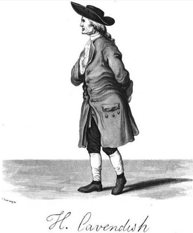
Afbeelding 1. Henry Cavendish. Schets en handtekening van Henry Cavendish (1731-1810).

Henry Cavendish (afbeelding 1) is een naam die wetenschapsliefhebbers wél zullen beantwoorden met een knikje van herkenning. De chemicus en natuurkundige was een persoonlijke vriend en collega-wetenschapper van Michell, en heeft een belangrijk deel van zijn faam te danken aan het vergeten genie. Het voornaamste fysisch experiment dat Cavendish' naam draagt, is de eerste precieze meting van de gemiddelde massadichtheid van de aarde. Om die waarde te achterhalen, moest hij eerst de notoir moeilijk te bepalen grootte - of beter 'kleinte' - van de universele gravitatieconstante G te weten komen. Het is voornamelijk dat resultaat waarvoor het 'Cavendishexperiment' als mijlpaal in de experimentele natuurkunde beschouwd wordt. Zijn resultaat week slechts 1% af van het huidig aanvaard getal; indrukwekkend!