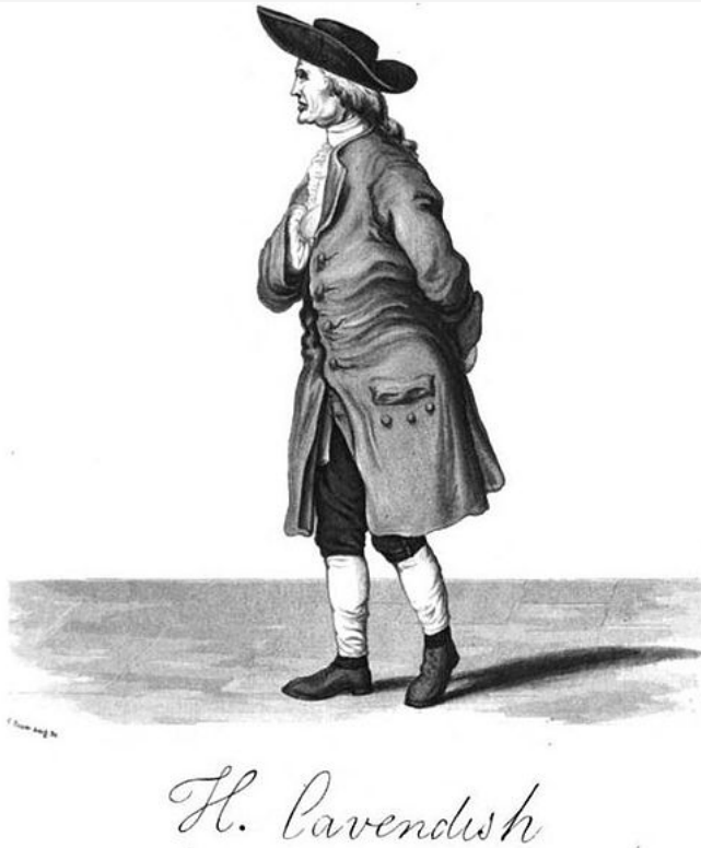
Afbeelding 1. Henry Cavendish. Schets en handtekening van Henry Cavendish (1731-1810).

Henry Cavendish (afbeelding 1) is een naam die wetenschapsliefhebbers wél zullen beantwoorden met een knikje van herkenning. De chemicus en natuurkundige was een persoonlijke vriend en collega-wetenschapper van Michell, en heeft een belangrijk deel van zijn faam te danken aan het vergeten genie. Het voornaamste fysisch experiment dat Cavendish' naam draagt, is de eerste precieze meting van de gemiddelde massadichtheid van de aarde. Om die waarde te achterhalen, moest hij eerst de notoir moeilijk te bepalen grootte - of beter 'kleinte' - van de universele gravitatieconstante G te weten komen. Het is voornamelijk dät resultaat waarvoor het 'Cavendishexperiment' als mijlpaal in de experimentele natuurkunde beschouwd wordt. Zijn resultaat week slechts 1% af van het huidig aanvaard getal; indrukwekkend!