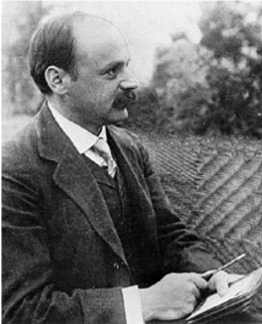
Afbeelding 3. Karl Schwarzschild. Karl Schwarzschild (1873-1916).

straal als de rigoureuze en dieper gemotiveerde berekening binnen de algemene relativiteitstheorie. Niet bijna hetzelfde, maar exact . Onderzoeken waarom dat zo is, zou ons te ver voeren, maar dat het eigenaardig is, staat buiten kijf.