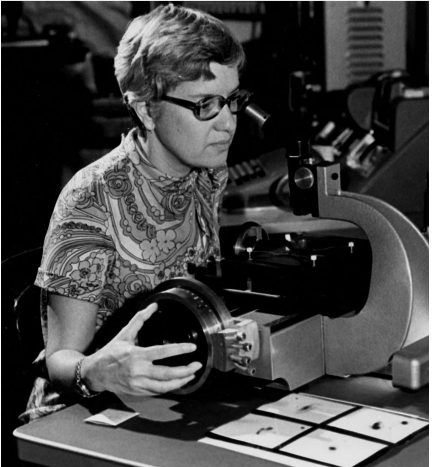
Afbeelding 1. Vera Rubin. Vera Rubin observeerde de rotatiekrommen van tientallen sterrenstelsels, en bevestigde daarmee onomstotelijk dat de zichtbare massa in sterrenstelsels niet groot genoeg is om hun rotatiesnelheden te verklaren. Bron: Dr. Rubin (1970)