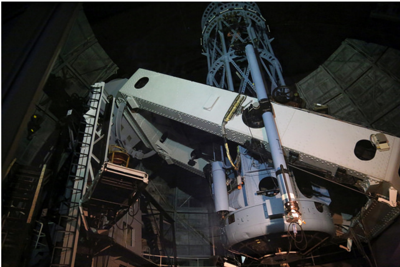
Afbeelding 1. De Hooker Telescope. De Hooker Telescope van het Mt. Wilson Observatory, waarmee Edwin Hubble zijn metingen deed.

Als we in de nacht naar de hemel kijken, zien we dat de zon, waar de aarde omheen draait, niet de enige ster is in het heelal. Door waarnemingen met telescopen en satellieten weten we dat de sterren die we zien onderdeel zijn van een sterrenstelsel. Bovendien bevat het heelal gigantisch veel van deze sterrenstelsels. In 1929 ontdekte Edwin Hubble iets heel bijzonders, namelijk dat alle sterrenstelsels die hij waarnam van ons af lijken te bewegen! In dit artikel leg ik uit hoe we deze observatie kunnen verklaren.