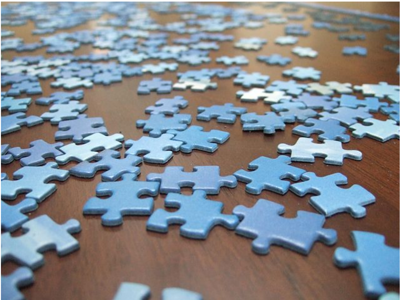
Afbeelding 2. Een puzzel. Hoe passen de verschillende puzzelstukjes van de fundamentele natuurkunde in elkaar?

Ook hier hebben we een deel van de onderwerpen al eens op deze site beschreven, en gaan we dat met de overige onderwerpen snel doen!