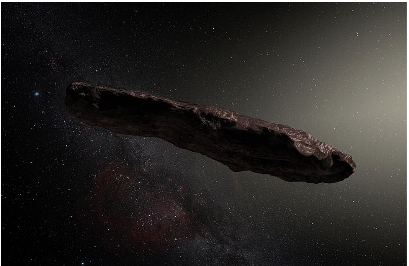
Afbeelding 1. Oumuamua. Een “artitst impression” van een van de mogelijke vormen van Oumuamua.