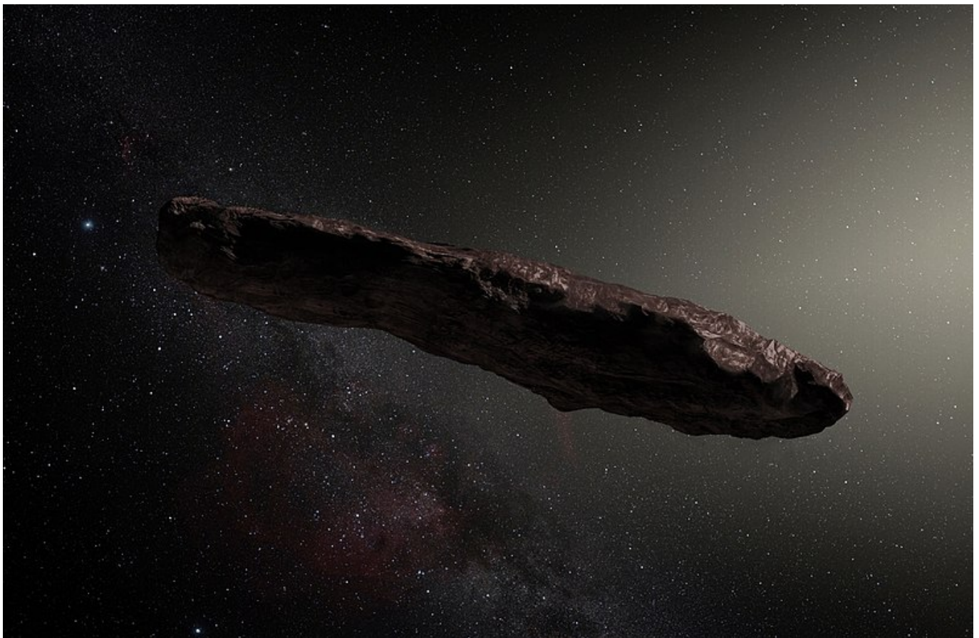
Afbeelding 1. Oumuamua. Een “artitst impression” van een van de mogelijke vormen van Oumuamua.