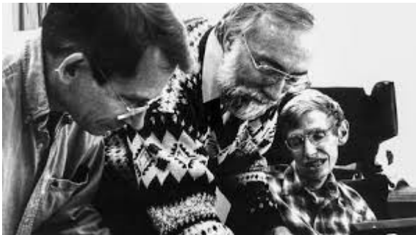
Afbeelding 2. Preskill, Thorne en Hawking. John Preskill, Kip Thorne en Stephen Hawking (van links naar rechts) sloten een wereldberoemde weddenschap af over de informatieparadox. De inzet was een encyclopedie naar keuze.