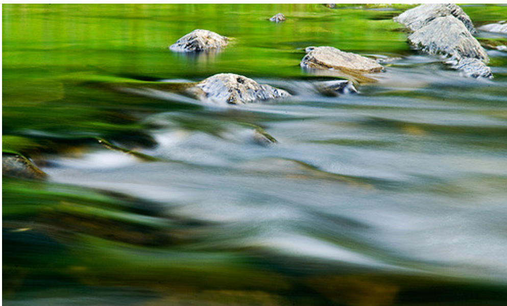
Afbeelding 1: Stromend water

De natuurwetten kunnen op verschillende lengteschalen sterk van elkaar verschillen. Zo zijn de wetten voor de kleinste bouwstenen, elementaire deeltjes, wezenlijk anders dan die van rondvliegende tafels en stoelen. Deeltjes zoals vrije elektronen gedragen zich volgens de wetten van de speciale relativiteitstheorie en de quantumtheorie. Daarentegen zijn tafels en stoelen onderhevig aan de regels van de klassieke Newtoniaanse mechanica. Op kleine lengteschalen gelden dus totaal andere natuurwetten dan op grotere lengteschalen. Er is wel een belangrijke eis. De theorie op kleinere schaal, die gedetailleerder is, moet de theorie op grotere schaal kunnen reproduceren. De reden hiervoor is eenvoudig. Veel watermoleculen bij elkaar vormen een plas water en dus moet de theorie voor de watermoleculen zo zijn dat als je er een vloeistof van maakt je de wetten van de hydrodynamica (de bewegingswetten voor vloeistoffen) terugvindt.