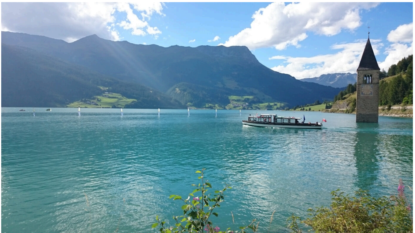
Afbeelding 3: De oude kerktoren van Graun steekt uit het stuwmeer Reschensee. Wereldwijd zijn er veel dorpen onder water komen te liggen door de constructie van een dam, zoals de dorpen Graun en Reschen in Zuid-Tirol, Italië. Foto: Noclador .

Helaas gaan dergelijke hydro-elektrische installaties gepaard met hun eigen problemen. Zo kunnen ze alleen gebouwd worden in een dal – waar we in ons uiterst platte Nederland dus weinig aan hebben – en op locaties met voldoende watertoevoer. Daarnaast vereist de constructie van een dam veel beton en staal, wat niet de meest duurzame materialen zijn. Ook vereist de bouw dat we het landschap drastisch veranderen, waarvan de ecologische consequenties groot kunnen zijn.