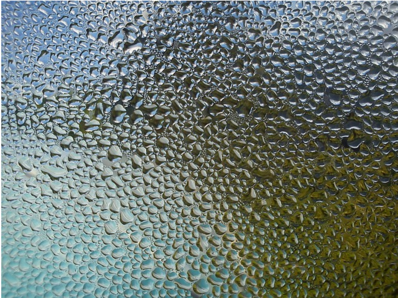
Afbeelding 1. Waterdamp op een glasplaat. De overgang tussen vloeibaar water en waterdamp is een van de vele fase-overgangen in de natuur.

Vast, vloeibaar, gas... het zijn bekende fasen van bijvoorbeeld water. Maar veel materialen en systemen kennen nog allerlei andere fasen – soms lijkend op vast, vloeibaar of gas, maar soms ook totaal anders, en bepaald door bijvoorbeeld de topologie van het materiaal. Kunnen we al die soorten fasen classificeren? Jorrit Kruthoff geeft een overzicht.