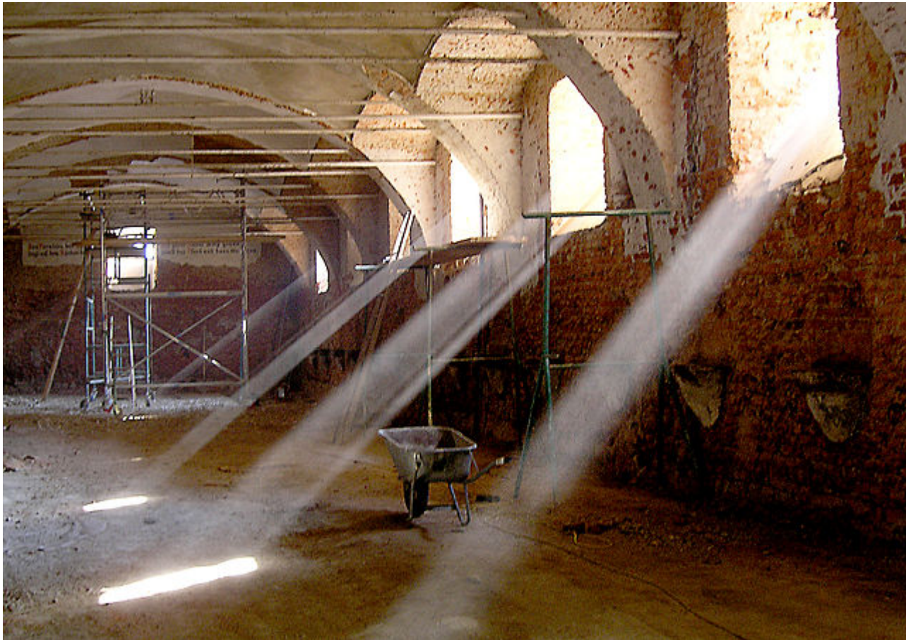
Afbeelding 3. Stof in de zon. Stofdeeltjes in de zon geven niet alleen een mooi schouwspel, ze gedragen zich ook volgens interessante onderliggende natuurkunde!

Kortom, de gemiddelde verplaatsing van stofdeeltjes gaat niet linear, zoals de verplaatsing van een auto die met constante snelheid rijdt, maar met de wortel van de tijd!