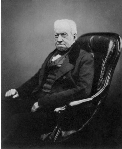
Afbeelding 1. Robert Brown (1773 - 1858)