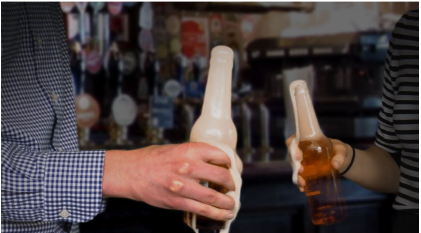
Afbeelding 1. “Beer tapping”.

De koning viert vandaag met zijn familie zijn verjaardag in Groningen (gefeliciteerd Majesteit!), maar uiteraard wordt er door het hele land gefeest en geproost op koning Willem-Alexander. Twee tips van de QU-redactie: 1) drink met mate, en 2) pas op dat niemand bovenop je bierflesje slaat. Dat laatste resulteert in een vervelend fenomeen: binnen enkele tellen stroomt er een enorme hoeveelheid schuim uit je bierflesje.