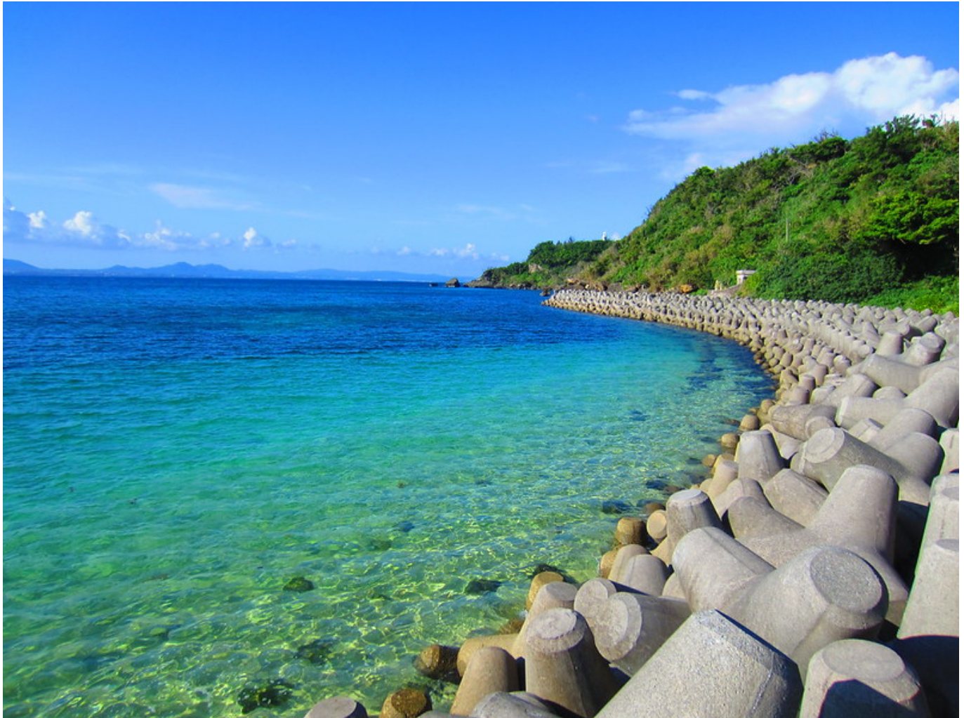
Afbeelding 1. Tetrapods. Tetrapods langs de kust van het eiland Ikei.

Je vindt ze overal langs de Japanse kust: tetrapods, enorme vierarmige blokken beton die erosie van de kuststructuren voorkomen. Samen vormen deze tetrapods een granulair metamateriaal : een granulair materiaal zoals zand, maar ontworpen en gemaakt door mensen. Er is een goede reden waarom tetrapods hun bijzondere vorm hebben. De uitgestrekte armen maken het moeilijk voor een stapel van dergelijke blokken om te stromen. In tegenstelling tot gewone rotsblokken blijven de tetrapods op hun plaats, en doen daarom wat ze moeten doen: voorkomen dat de kustlijn verandert.