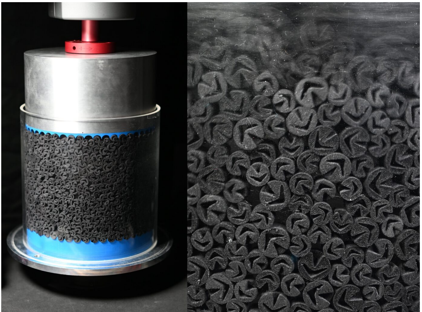
Afbeelding 3. Een nieuw materiaal. Links: een van de instrumenten waarmee de nieuwe korrels werden onderzocht. Rechts: close-up van de korrels.

richting krimpen. Dat betekent dat, als je een stapeling van zulke korrels samendrukt, de hoeveelheid vrije ruimte tussen de korrels grofweg hetzelfde blijft, met als gevolg dat de stroomeigenschappen van de korrels vergelijkbaar blijven met die van een vloeistof. Haver: “De krachten binnen het materiaal blijven klein. De stapeling is daardoor niet alleen goed samendrukbaar, maar stroomt ook veel beter. We stopten de korrels in een trechter. Normaal gesproken vormen de korrels dan een boog die het stromen verhindert. Zodra deze korrels echter krimpen ten opzichte van de trechtermond gaan ze uiteindelijk stromen. Er werd altijd gedacht dat granulaire materialen moeilijk samendrukbaar moesten zijn en dat het aanpassen van de korrels de stroomeigenschappen zouden doen afnemen. Met onze nieuwe korrels slaan we een heel nieuwe weg in, waar we heel andere stapelingen kunnen maken die eenvoudig samendrukbaar zijn en toch gemakkelijk stromen.”